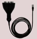
キャビテーション プローブ