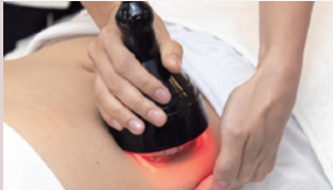
キャビテーション

ボディ専用のキャビテーションプローブと電床パッドの組み合わせで、ANION超音波によるマルチトリートメントを実現します。