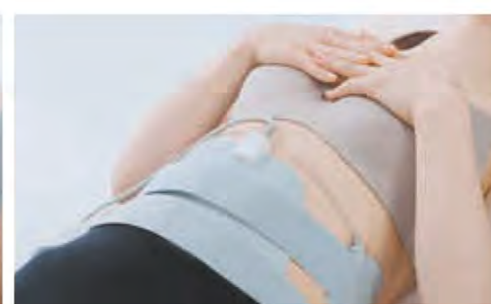
6極電極パッド 腹部