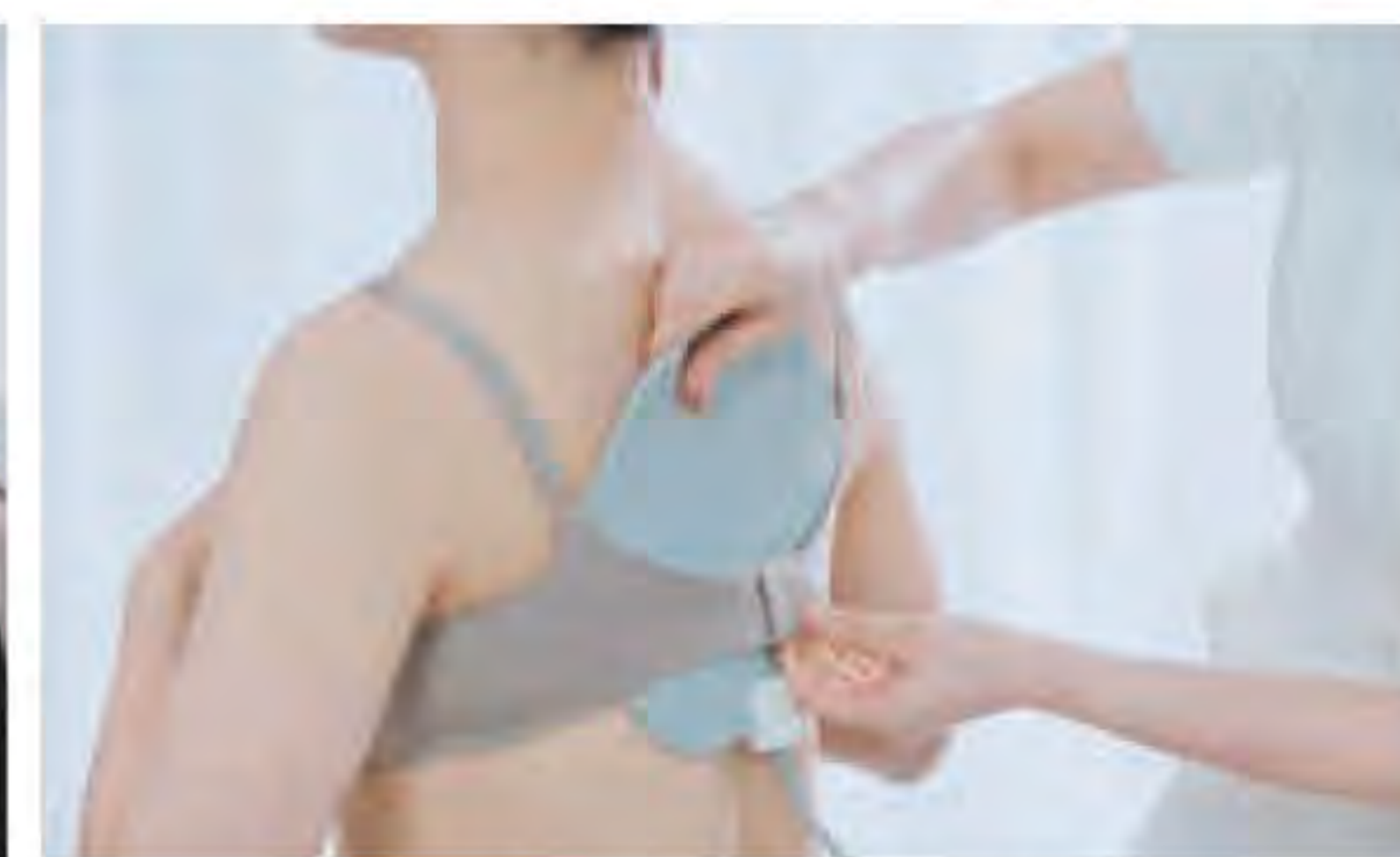
6極電極パッド 背中