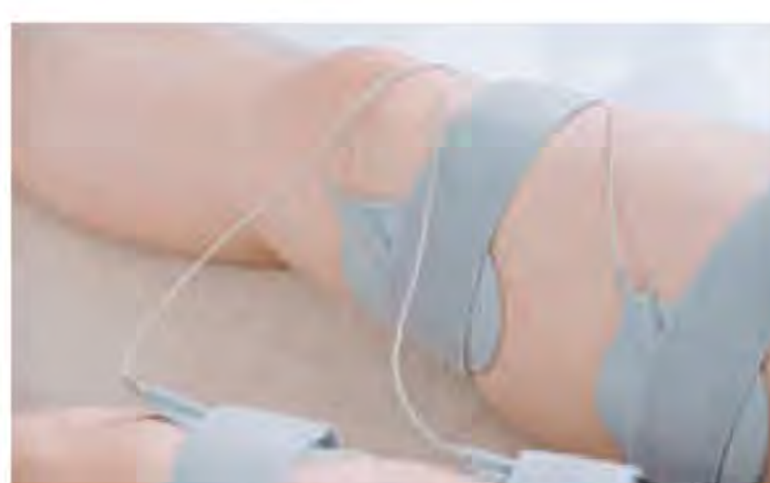
グレーパッド6枚 足や腕にも